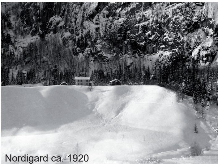
Nordigard ca. 1920