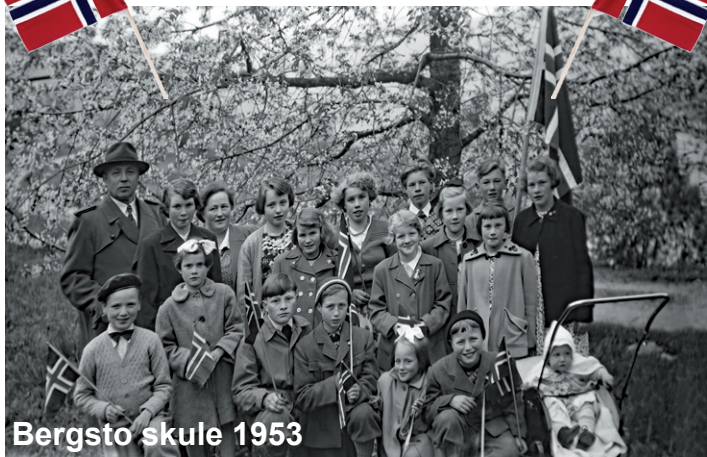
Bergsto skule 1953