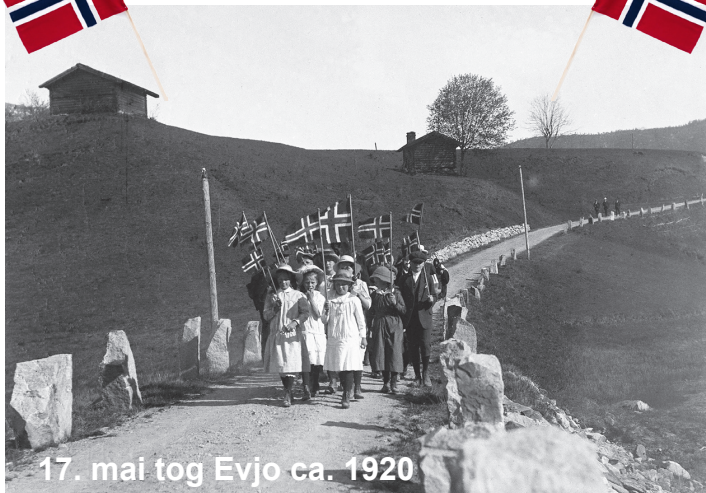
17. mai tog Evjo ca. 1920