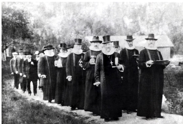
Prosesjon på innvielsesdagen 1916